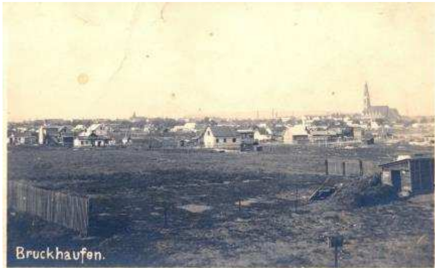
Ansichtskarte „Bruckhaufen“, 1930er-Jahre, © Bezirksmuseum Floridsdorf, Wien.

Nach der Eingemeindung von Floridsdorf in die Stadt Wien im Jahr 1904 entwickelte sich auf dieser Anschwemmung der Donau („Haufen“) ein Erholungsgebiet mit Badehütten und Schrebergärten. Nach dem Ersten Weltkrieg wurden hier viele Häuser ohne baubehördliche Genehmigung errichtet. Es entstanden sogenannte „wilde Siedlungen“. Bis zum Holocaust war der Bruckhaufen an der Alten Donau auch ein traditionelles Siedlungsgebiet vieler Roma und Sinti. Ursprünglich fahrende Familien ließen sich hier in den 1920er-Jahren nieder. Nach und nach wurden aus Wohnwägen feste Häuser aus Holz und Stein.