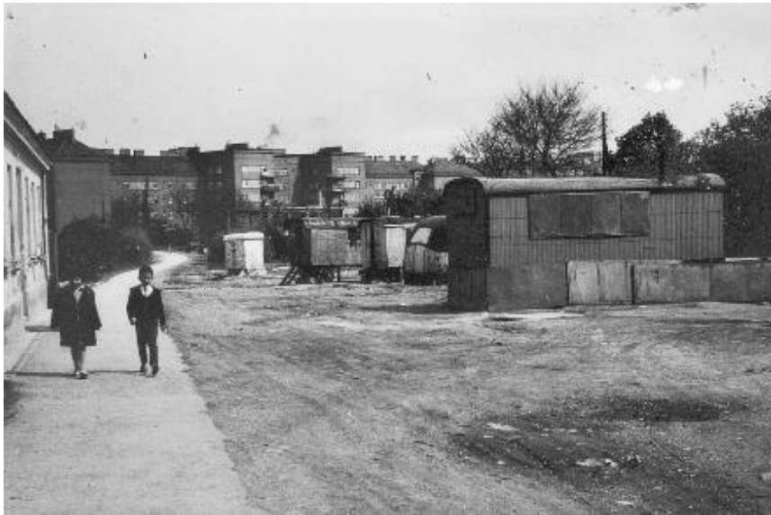
Am Ringelseeplatz in Floridsdorf, 1930er-Jahre, © Bezirksmuseum Floridsdorf, Wien.

Der Ringelseeplatz in Floridsdorf wurde spätestens seit den 1920er-Jahren von Roma und Sinti als Rastplatz für vorübergehende Aufenthalte genutzt. Auch in den Nachkriegsjahren war der Ort Wohnplatz einiger Überlebender. Familien aus dem ehemaligen Jugoslawien ließen sich in den 1950er-Jahren hier nieder. Mit der Ungarnkrise 1956 zogen Flüchtlingsfamilien, die im Zuge des Aufstandes ihr Land verlassen mussten, hinzu.